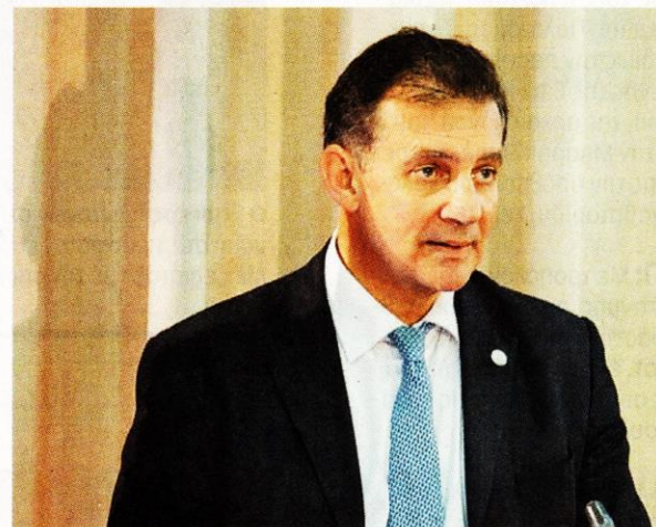
Ο πρόεδρος του ΕΚΠΑ απευθύνει χαιρετισμό.

που θα προάγουν την πρόοδο του κοινωνικού συνόλου. Ο κ. Κόκκινος ανέγνωσε ψήφισμα της γενικής συνέλευσης της ένωσης, το οποίο ανακήρυξε τον Πρόεδρο της Δημοκρατίας επίτιμο πρόεδρο της ένωσης, καθώς ο πρώτος πολίτης της χώρας είναι διακεκριμένος ομότιμος καθηγητής.