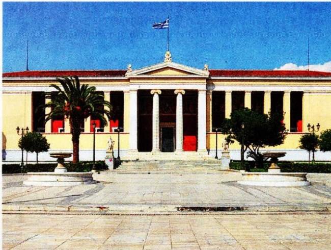
Η έναρξη του συνεδρίου έγινε στο Πανεπιστήμιο Αθηνών.

Μιλώντας για τον τίτλο του συνεδρίου, «Το κεφάλαιο της γνώσης», υπογράμμισε ότι η γνώση δεν συνίσταται στην απλή απαρίθμηση γεγονότων και στοιχείων, αλλά περιλαμβάνει την αναζήτηση της αλήθειας και την εισαγωγή στη δημιουργική σκέψη και αναζήτηση, με στόχο επιτεύξεις